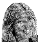
di Chiara Giaccardi

Accanto e in relazione: ecco il realismo evangelico